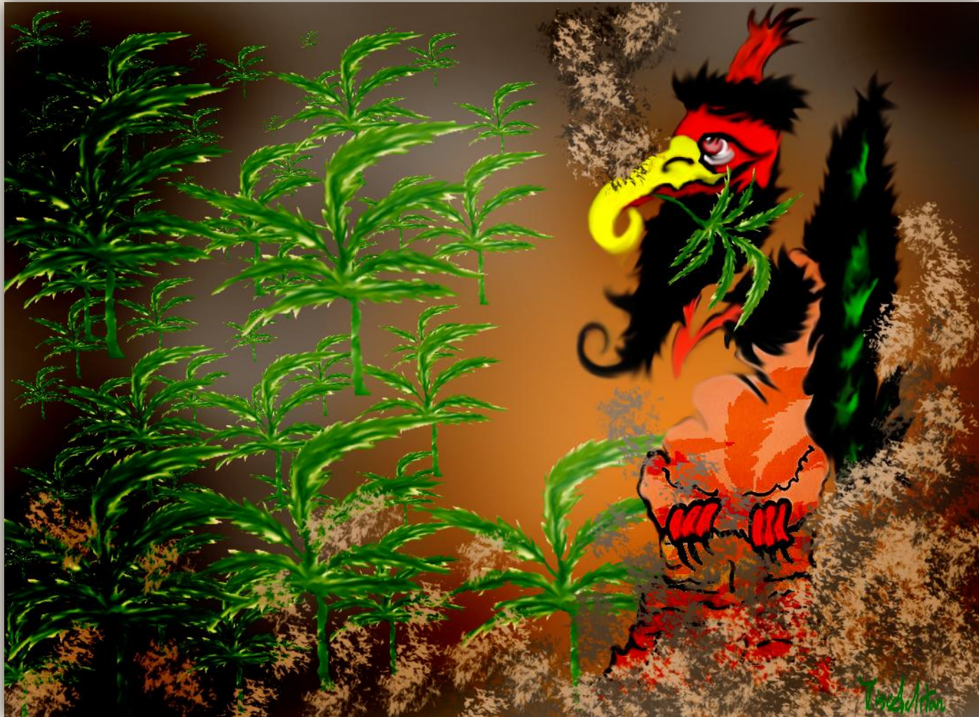
Illustration du livre : dessin de Miss Ahtar « Drogue dure »