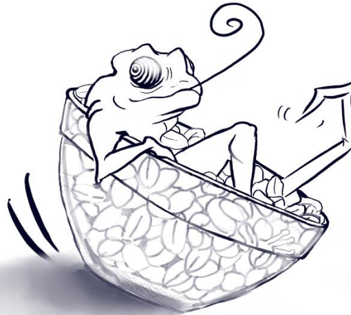
Illustration du livre