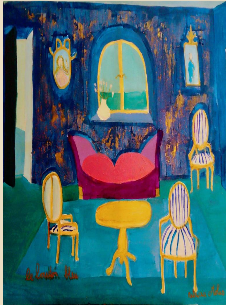
Illustration du livre